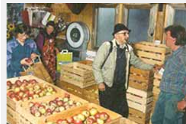
Bio-Produzentinnen und Konsumenten waren mit der Ökoverordnung von 1991 zufrieden.