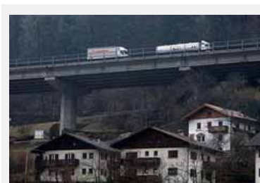
Rund 20.000 LKW mehr als im Vorjahr querten in diesem Januar die Alpen über den Brenner.

Quelle und Infos: http://www.bmvbs.de/-,302.986635/Tiefensee-Trendwende-beim-Schi.htm (de)